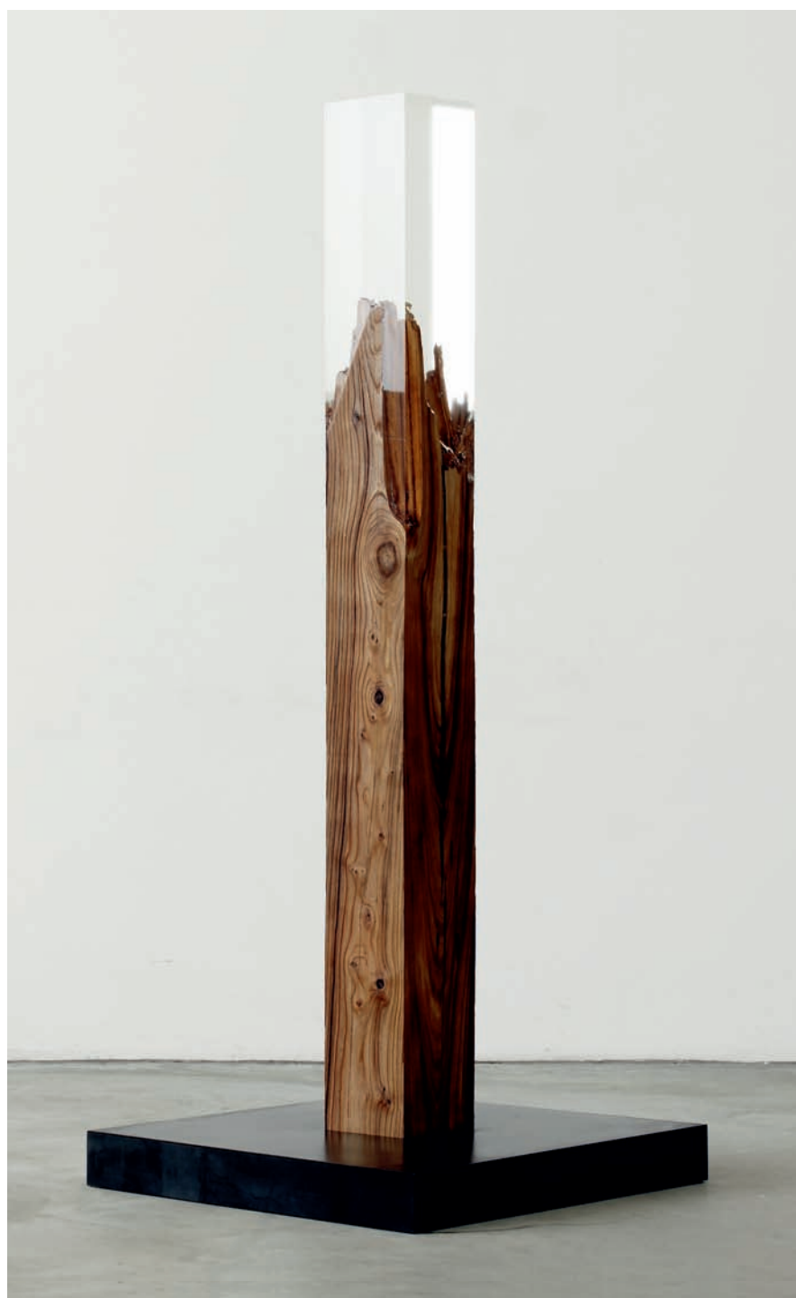
ergänzung, 2010 ulmenholz, plexiglas 201 x 20,5 x 20,5 cm metallsockel 11 x 86 x 86 cm winkel-ergänzung 45,5°, 1986 ulmenholz, plexiglas 202,5 x 260 x 22,5 cm

gestaltung: karl-achim czemper, hamburg druck: nejedly gmbh, friedrichsdorf