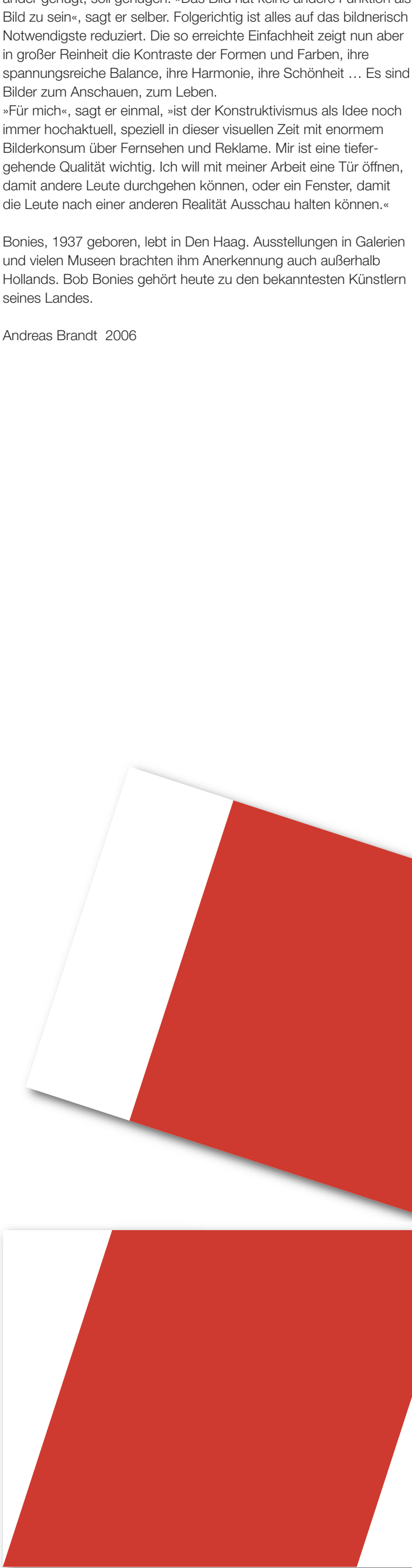
1967, Acryl auf Leinwand, 230x160 cm, zweiteilig